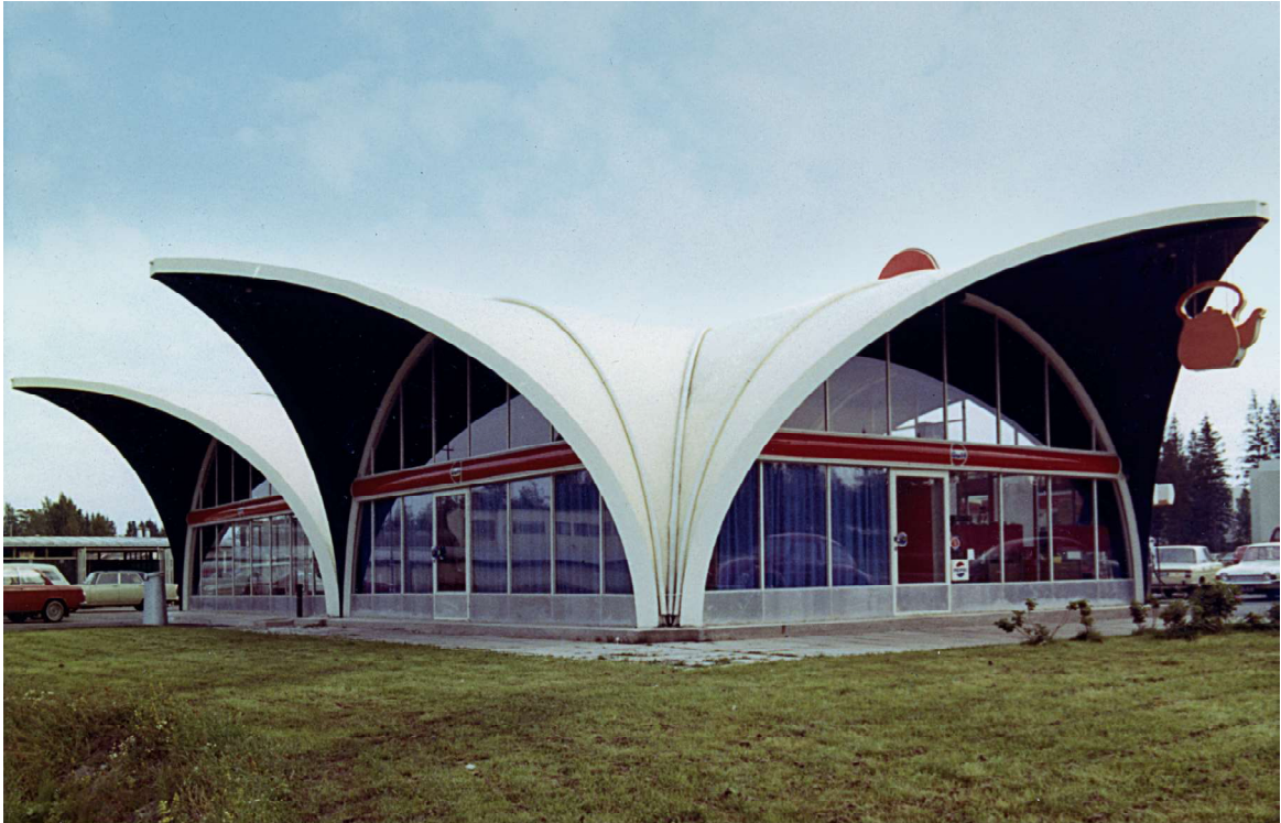
Vanamotien huoltoasema lähes alkuperäisessä asussaan.